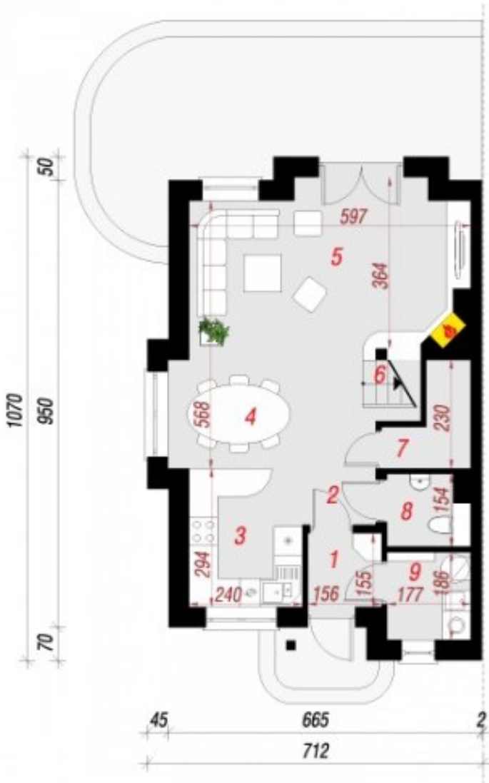
Parter - 55 m 2